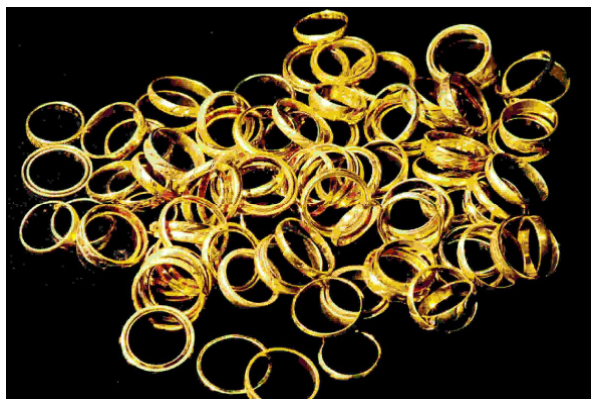
Trauringmodelle 030